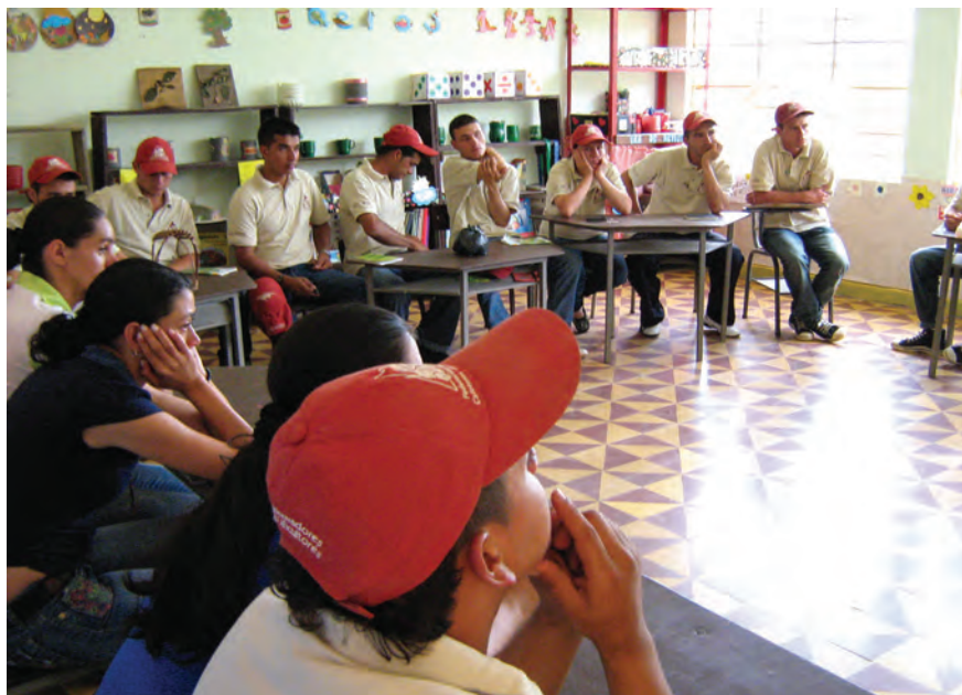
Sesión de trabajo, UCAE-Valle del Cauca